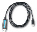
Interfaccia VE.Direct a USB